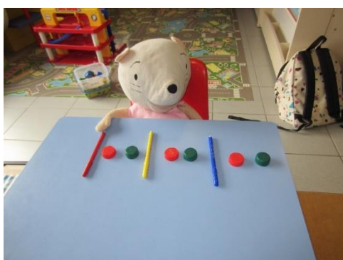
Alternance de 3 objets